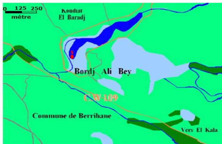
Figure 1 : Localisation de la station de prélèvement (S) dans la tourbière du lac Noir

La tourbière du lac Noir est situé au Nord– Est Algérien, à une latitude 36^{\circ} 51' Nord, une longitude de 08^{\circ}12' Est, et une altitude de 15 mètres. Il est situé sur le chemin de la wilaya N°109, reliant la ville d'Annaba à El-Kala, il est situé dans le complexe des zones humides d'El-Kala. C'est un ancien lac asséché accidentellement, depuis, il ne reste que la tourbière sous-jacente, qui remplace aujourd'hui l'ancien lac. Elle présente une superficie de 5 hectares, et une faible profondeur (maximale de 1,5 mètre). En effet, ce plan d'eau peut s'assécher totalement durant les périodes chaudes (Boumezbeur, 2002). Pour le choix de la station de prélèvement, en raison des conditions d'accès difficile à la tourbière, on s'est limité à une seule station (S) au niveau du littoral de la tourbière (Figure 1).